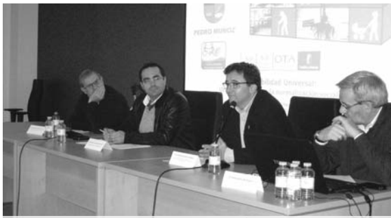
Imagen de los ponentes en la inauguración de la jornada