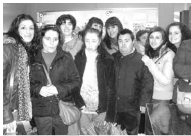
Imagen en las instalaciones del Parque

Algunas de las especies más representativas de este Parque Nacional, son las grandes rapaces, como el Águila imperial ibérica, la Cigüeña negra, o el Buitre negro, mamíferos como el ciervo, el Corzo o Jabalí entre otras especies, y una rica flora con una gran variedad de árboles y arbustos propios del bosque mediterráneo y una amplia serie de microclimas, bosques de galería, trampales, bohonales,