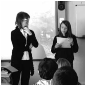
Lectura en el Ángel Andrade / M o José G o