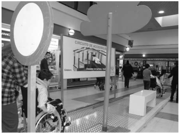
Imagen del circuito de accesibilidad / COCEMFE ORETANIA

Cocemfe Ciudad Real agradece el patrocinio del Patronato Municipal de las Personas con Discapacidad de la capital y la colaboración de todos los establecimientos de componen el centro comercial El Parque-Eroski.