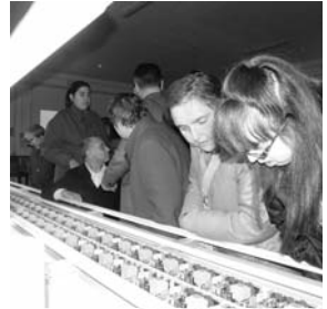
Observando algunas de las piezas / M. J. G.