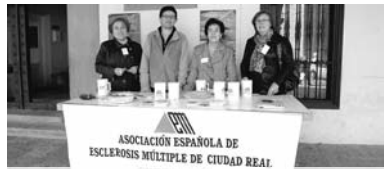
La sociedad se muestra cada día más concienciada