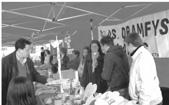
El alcalde visitó el mercadillo solidario / Cocemfe Oretania

El colectivo salió a la calle el pasado 4 de diciembre con los objetos que elaboran y "la aceptación fue muy buena"