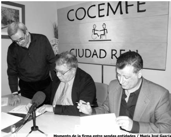
Momento de la firma entre sendas entidades

"La accesibilidad es una condición que afecta a todos. De ma-