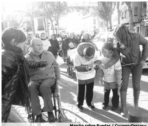
Marcha sobre Ruedas / COCEMFE-ORETANIA