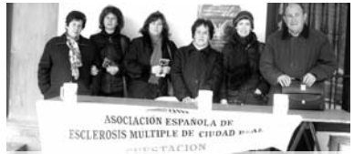
Las cuestaciones han sido en toda la provincia

La campaña concluyó el pasado día 18, efeméride del Día Nacional de las Personas con Esclerosis Múltiple. "La mayoría de las fechas han resultado gélidas, algunas de ellas, incluso, pasadas por agua. Pero en todas, sin excepción, ha