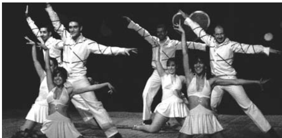
Tropical Son sobre el escenario