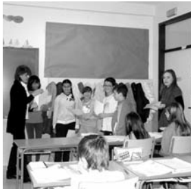
Premios en el J. M o de la Fuente