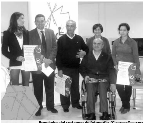
Premiados del certamen de fotografía