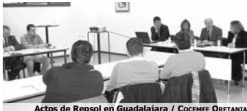
Actos de Repsol en Guadalajara

Se les explicó a los empresarios tanto los beneficios sociales que reporta la contratación de personas con discapacidad en sus estaciones de servicio (mejora de imagen, fidelización de clientes, etc), como los beneficios económicos, (bonificaciones en las cuotas de la Seguridad Social, subvenciones a la contratación indefinida, o para la adaptación del lugar de trabajo). COCEMFE CLM va a impartir, en