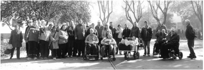
Foto de familia de los chicos del Centro Ocupacional y la Residencia Vicente Aranda

El Centro Especial de Empleo vivió una jornada de reencuentros con la visita de algunos integrantes del Centro Ocupacional de Campo de Criptana