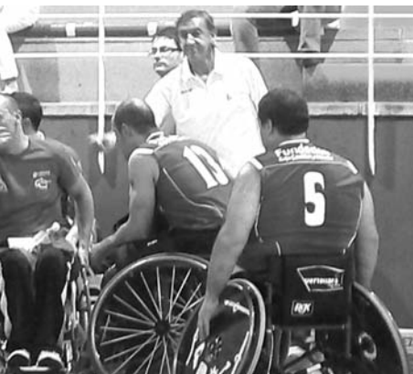
Imagen de archivo del equipo / Cocemfe-Oretania