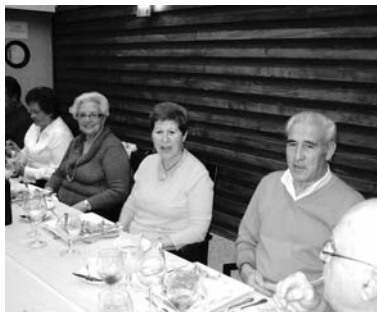
Momento de la comida navideña de socios