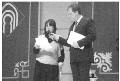
La presidenta de Aedem Ciudad Real /Cocemfe-Oretania

Fueron más de dos horas de disfrute artístico y estético donde se pudo presenciar una variedad muy extensa de tipos de bailes modernos, tanto en personas adultas como en infantiles, danzas orientales de diversos colores y plasticidad. Flamenco, el tan de moda baile Hip Hop, Bachata, Salsa y una extensa gama de bailes de Salón fueron las piezas principales que la Academia Azúcar interpretó. "Estamos seguros que los asistentes dis-