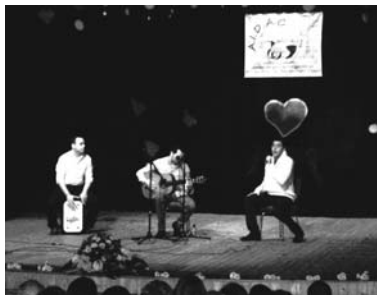
Imagen de una de las actuaciones

"desde el Ayuntamiento de Almodóvar del Campo siempre apoyaremos este tipo de acciones que sirven para ayudar a este colectivo y a sus familias y, además de colaborar, los vecinos disfrutaron con estos espectáculos tan variados de música española", finalizó.