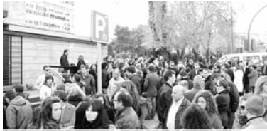
Los trabajadores de Cocemfe CLM ven con mucha incertidumbre su futuro / COCEMFE ORETANIA

programas que se vienen desarrollando y que terminan el 31 de diciembre de 2011".