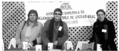
Imagen de las cuestaciones

ganado el calor de la gente y las ganas y las buenas voluntades de todos los que han participado en estas jornadas", prosigue. "La Esclerosis Múltiple ya no es una enfermedad ante la que la gente pone cara de extrañeza, al contrario, existe interés por conocer cada vez más cosas, nuevos avances y posibles vías de tratamiento. Nuestro