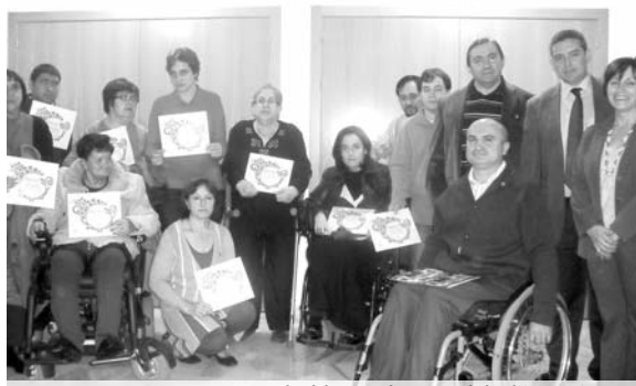
Entrega de Diplomas a algunos asociados

Asimismo, el Día Internacional de las Personas con Discapacidad fue emotivo e intenso. La VII Marcha sobre Ruedas alcanzó un gran éxito gracias a la sensacional acogida por parte de la localidad y sus visitantes. Más de trescientas personas se concentraron en la Plaza Mayor, donde pudieron obtener información,