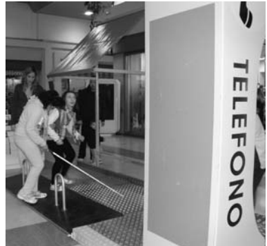
En la imagen se observa la dificultad que entrañan los toldos demasiado bajos