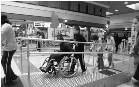
Alumnos del colegio Ángel Andrade realizando la actividad