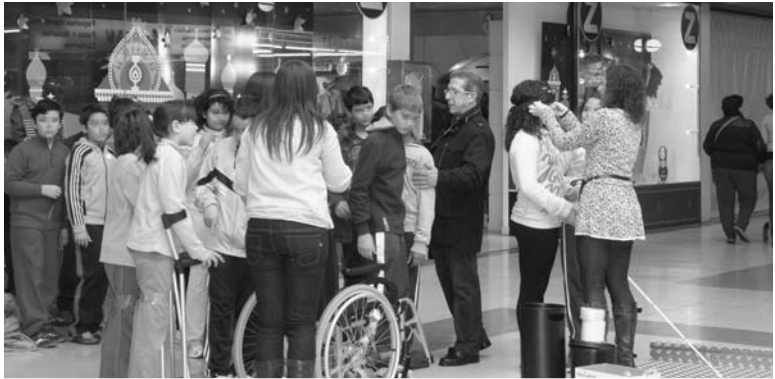
El equipo de Cocemfe les preparaba antes de iniciar el recorrido