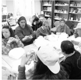
Imagen de la comida

La Residencia daimieleña organizó un concurso de dibujo para alumnos de primaria. Los niños reflejaron en sus trazos como ven ellos el mundo de la discapacidad. Los ganadores fueron obsequiados por Cocemfe Oretania Ciudad Real. La Federación agradece desde este medio, la alta participación de este año y el interés mostrado por el colectivo.