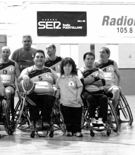
Imagen de archivo / Oretania