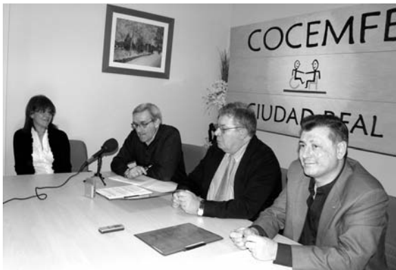
De Frutos, Baena, Arias y De la Nieta / MARÍA JOSÉ GARCÍA

Con la firma de este convenio, la acción coordinada de ambas entidades, complementaria entre sí, sumará más que las acciones individuales.