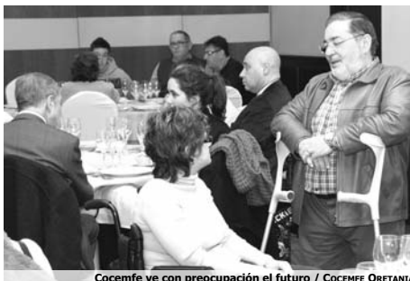
COCEMFE ve con preocupación el futuro / COCEMFE ORETANIA

Según el presidente de COCEMFE, "la crisis no puede ser la excusa para detener las políticas públicas de discapacidad y mucho menos para reducir los derechos de este colectivo. Los recortes no pueden continuar porque ya se están resintiendo los niveles de inclusión social. Por ello, es necesario que se sigan apoyando los programas