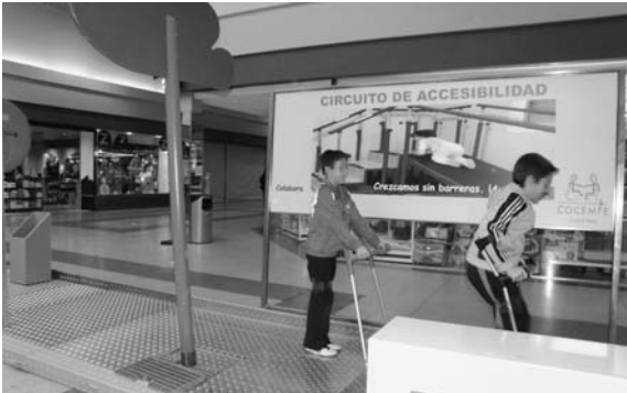
Los participantes con muletas llevaban laspiernas 'atadas' para simular una discapacidad física

Coincidiendo con la efeméride del Día Internacional de las Personas con Discapacidad, Cocemfe Ciudad Real estableció su Circuito de Accesibilidad en el centro comercial El Parque-Eroski.