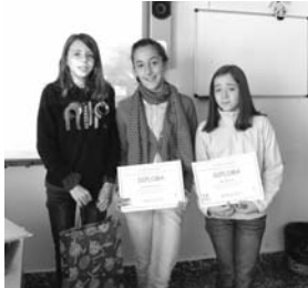
Premiadas en el Ángel Andrade / M o J. G o