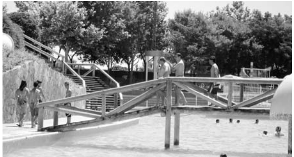
Imágenes de las instalaciones de Playa Park