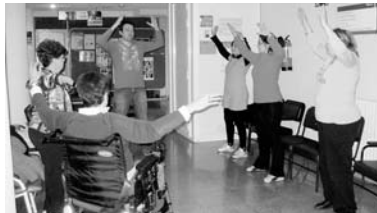
El Tai Chi ayuda a paliar los síntomas de la artritis