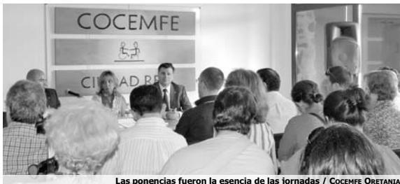
Las ponencias fueron la esencia de las jornadas / COCEMFE ORETANIA

La clausura fue protagonizada por la miembros de la asociación Amipora, de Porzuna, que interpretaron el clásico de "El Quijote". Una actividad de la cuál se informa específicamente en la página 12 de este periódico.