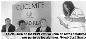
La clausura de los PCPI estuvo llena de actos emotivos por parte de los alumnos

El acto terminó con la entrega de diplomas y con un emotivo video de las actividades realizadas durante todo el periodo lectivo.