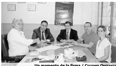
Un momento de la firma

Entre los servicios que se prestan destacan el apoyo a las actividades de la vida diaria, fisioterapia, terapia ocupacional, sala de relajación multisensorial, reeducación cognitiva y del lenguaje, animación sociocultural, terapia psicológica, asistencia social, transporte adaptado, equinoterapia, acuatrapia y deporte adaptado.