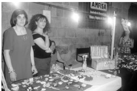
Amfisa expuso gran parte de los objetos que realizan en sus talleres