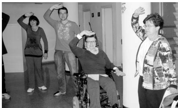
Algunos de los asociados practicando Tai chs

El taller, que tiene un carácter anual puesto que se recomienda un trabajo continuado, se desarrolla en la sede de Acrear y se centra en "los 8 tejidos de seda", es decir, estiramientos especialmente diseñados para fortalecer la relación músculo tendón, que beneficia al tratamiento de patologías reumáticas.