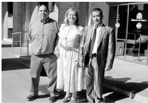
Presidente y tesoroero de Aisdí, junto con la concejala de Bienestar Social de Puertollano, a las puertas del Ministerio de Política Social