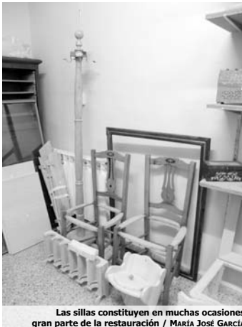
Las sillas constituyen en muchas ocasiones gran parte de la restauración

son más fáciles de emplear y corregir si se comenten errores". Así se ha de seguir dirección de la veta de la madera hasta que se haya cubierto toda la superficie del mueble. "Hay veces que se emplea un paño de algodón después, con el fin de eliminar el exceso de tinte y evitar las saturación del color". Después de todo este proceso, se ha de dejar secar durante al menos dos días en un lugar ventilado y seco, donde no le dé el sol directo, por ello, y a pesar de que el espacio de la sede es reducido, se puede