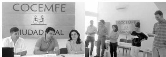
Un par de momentos del acto de clausura

El ayuntamiento de Bolaños de Calatrava ha sido el principal colaborador de la actividad, ya que tanto formación como práctica, se han llevado a cabo en el consistorio tiene un total de 1389 metros cuadrados, disponibles para este tipo de actividades. "En estos edificios habéis podido trabajar y de igual manera pretendo seguir colaborando con Cocemfe y el colectivo en esta legislación", finalizó Valverde.