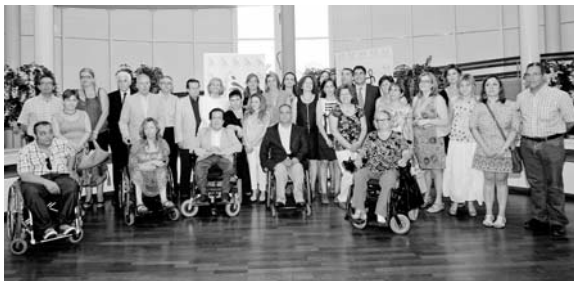
Foto de familia con usuarios, familiares y trabajadores

Un total de 20 personas a las que se les reiteró la necesidad de los entornos accesibles para todas las personas, no sólo para las personas con discapacidad.