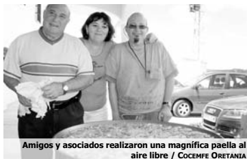
Amigos y asociados realizaron una magnífica paella al aire libre

Sin duda, una experiencia inolvidable para ellos. "Por eso pretendemos solicitarla también para el año próximo, para que así el máximo de personas pueda disfrutarla", concluye el presidente de la entidad.