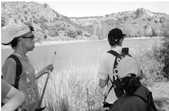
Adifiss fue una de las asociaciones que se benefició de la ruta senderista