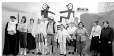
Los actores de Amipora que interpretaron Don Quijote / COCEMFE ORETANIA

asociación porzueña, llegó la hora de salir al escenario. Nervios y miedo escénico quedaron atrás cuando los integrantes pisaron las "tablas" del espacio reservado en el albergue rural de Puerto Vallehermoso, en La Solana. Sus propios compañeros y gran parte de los integrantes y directores de las asociaciones federadas que conforman Cocemfe-Oretania Ciudad Real esperaban expectantes. Y el resultado fue todo un éxito, que quedó patente y demostrado en el aplauso que Amipora recibió.