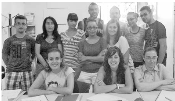
Foto de familia de los integrantes del curso de Lenguaje de Signos

Oranfys desarrolla desde el pasado 4 de julio y hasta el próximo 31 de agosto el taller Lenguaje de Signos, en el que alumnado está aprendiendo cómo comunicarse con personas con discapacidades, principalmente auditivas