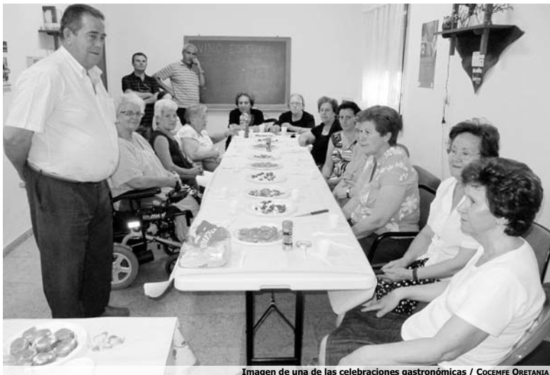
Imagen de una de las celebraciones gastronómicas

Sin embargo, la protagonista indiscutible durante estos meses ha sido la gastronomía, gracias a la celebración de una Jornada de Apicultura y Cata de Mielles en la que los asistentes descubrieron multitud de curiosidades sobre la apicultura; el funcionamiento de una colmena o los productos que fabrican las abejas. Además, pudieron degus-