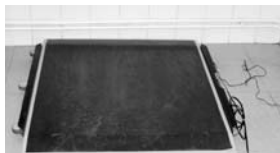
La báscula es una plataforma de fácil acceso a cualquier modelo de silla de ruedas

Además, Ciudad Accesible tiene disponible una rampa ligera y plegable para salvar un escalón que se cederá en uso, por tiempo limitado, a las personas que lo soliciten.