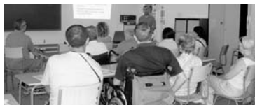
Asistentes a la charla / COCEMFE ORETANIA