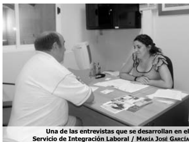
Una de las entrevistas que se desarrollan en el Servicio de Integración Laboral / MARÍA JOSÉ GARCÍA

Por este motivo, el máximo responsable de la entidad animó a los empresarios a apostar por este co-