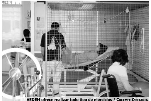
AEDEM ofrece realizar todo tipo de ejercicios / COCEMFE ORETANIA