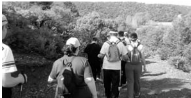
Los integrantes de Adifiss caminaron varios kilómetros a orillas de las lagunas

La jornada sirvió de encuentro con otras asociaciones de la provincia y la región, ya que reunió a un total de 86 personas de las asociaciones Afad, Apam, Coraje, Adace Albacete y Ciudad Real y Laborvalía, y supuso el comienzo de las cinco rutas que el Gobierno de Castilla-La Mancha tiene programadas hasta el mes de noviembre. Así, las próximas citas serán en La Hoz el Río Dulce, el 15 de octubre en la provincia de Guadalajara, y en la Sierra de San Vicente, el 12 de noviembre en Toledo.