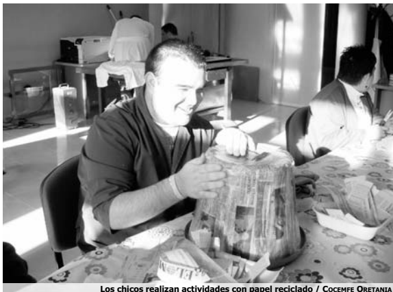
Los chicos realizan actividades con papel reciclado

Trabajos que se desarrollan en los talleres de papel maché, tapicería y serigrafía, donde se desarrollan todas las acciones anteriormente citadas. Por todo esto, la asociación malagonesa pretende que la sociedad se conciente de la importancia de la integración laboral de las personas con discapacidad.