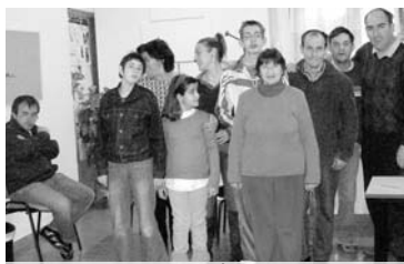
Ensayos de la obra 'El Árbol Mágico de Oranfía' / COCEMFE ORETANIA