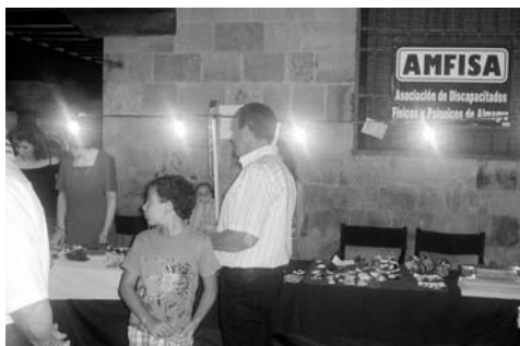
El puesto de Amfisa se ubicó cada noche en la playa de Almagro