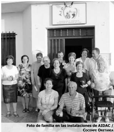
Foto de familia en las instalaciones de AIDAC / COCEMFE ORETANIA

probar algunas especias mediante el maridaje con distintos alimentos. Sin duda, una oportunidad única para conocer las propiedades que estas plantas otorgan a sopas, ensaladas, postres o salsas.