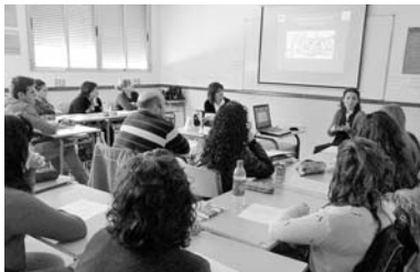
Imagen del taller que se desarrolló en Tomelloso