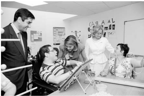
Un momento de la visita de la presidenta castellano-manchega

http://promociones.universia.es/microsites/promociones/fundacion_becas_capacitas/index.html