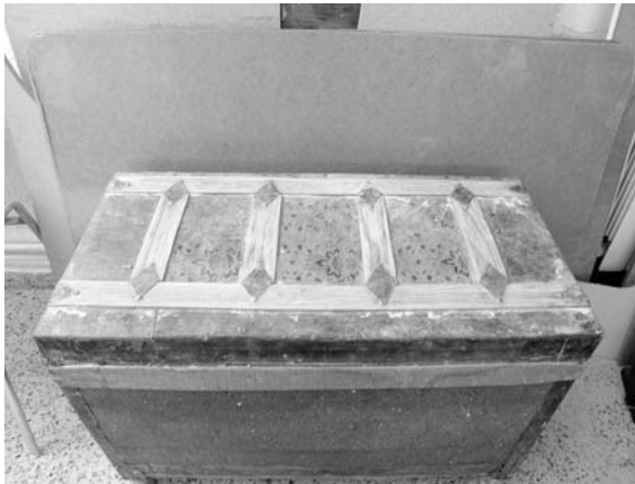
Uno de los baúes que se tiene previsto restaurar

La Asociación Sagrada Familia de Herencia lleva a cabo durante varios años el taller de Restauración de Muebles, con el fin de hacer revivir muebles, que en muchas ocasiones ocupan los lugares más olvidados de las casas