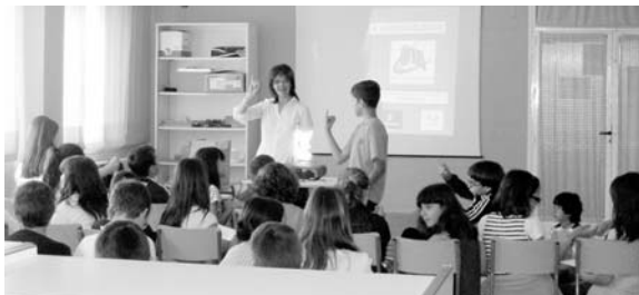
Malagón fue otra de las localidades a las que llegó el taller organizado por la OTA / COCEMFE ORETANIA