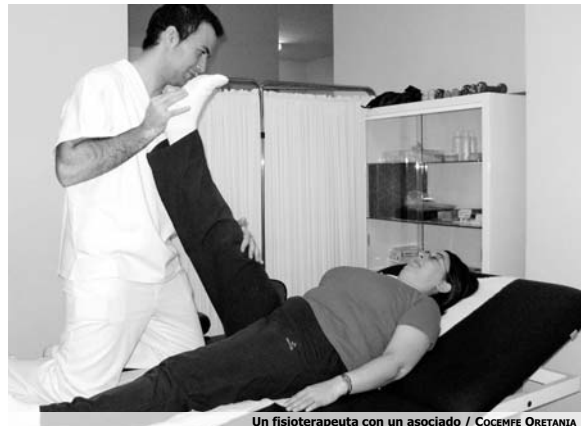
Un fisioterapeuta con un asociado