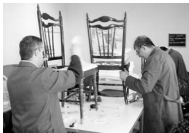
Otro de los talleres es de tapicería / COCEMFE ORETANIA