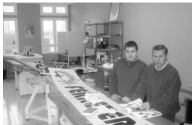
El taller de serigrafía también es parte de las actividades del Centro Ocupacional / COCEMFE ORETANIA