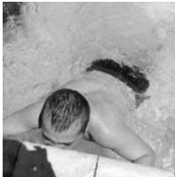
Los integrantes del centro ocupacional disfrutaron y se ejercitaron en el agua

El verano trae consigo jornadas más largas y calurosas que acompañan al ocio y disfrute al aire libre. Los parques acuáticos se convierten en el epicentro de este tipo de jornadas, ya que son lugares propicios para refrescarse de las altas temperaturas de las que se gozan en el centro de la llanura manchega. Conscientes de este hecho, el Centro Ocupacional Cocemfe de Bolaños organizó el pasado 8 de julio una salida hacia