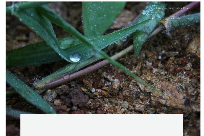
Imagen: Nathalia Díaz